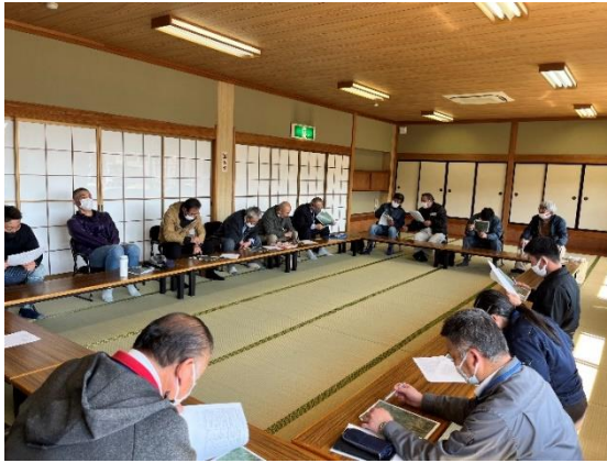
【各種団体関係者との意見協議の場①】