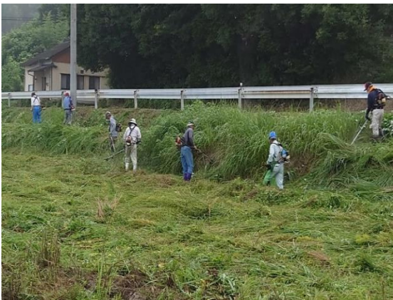
【遊休農地解消作業活動 (田)】