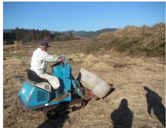
【遊休農地解消作業活動 (畑)】