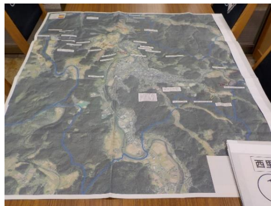
【遊休農地の位置特定作業】